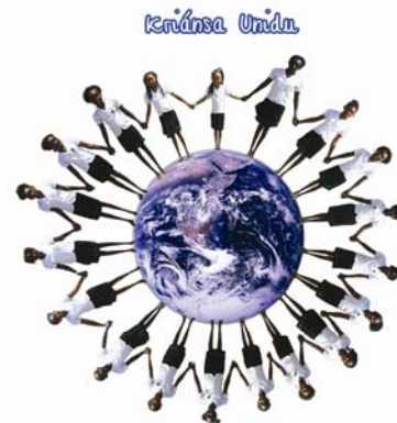
novo CD e DVD de Batukinhas Fidjus de delta